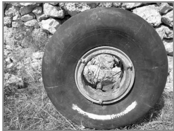
It-tyre tal-ajruplan Ju88 li sabu s-Slembi u l-Bunker fil-bajja taċ-Ċirkewwa

Allura ġiehom idea brillanti. Iddeċidew li jagħmlu din il-biċċa xogħol bil-lejl! Qatt ma għaddielhom minn mohħom li s-suldati fid-dlam setgħu jaħsbuom xi Ġermaniżi jew Taljani li niżlu biex jispjijaw jew jagħmlu xi sabutaġġ! Imma mid-dehra, l-għassa tas-suldati ma tantx kienet tajba għax ma ndunaw b'xejn, minkejja li dawn iż-żewġt iħbieb